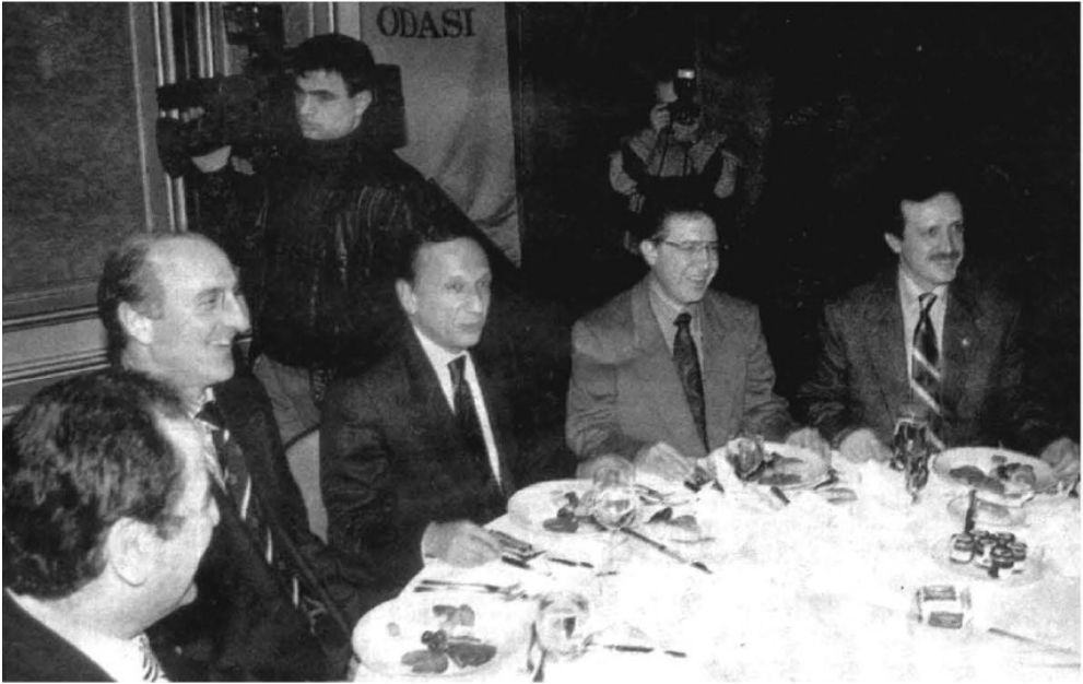
مرشح لرئاسة بلدية مدينة اسطنبول