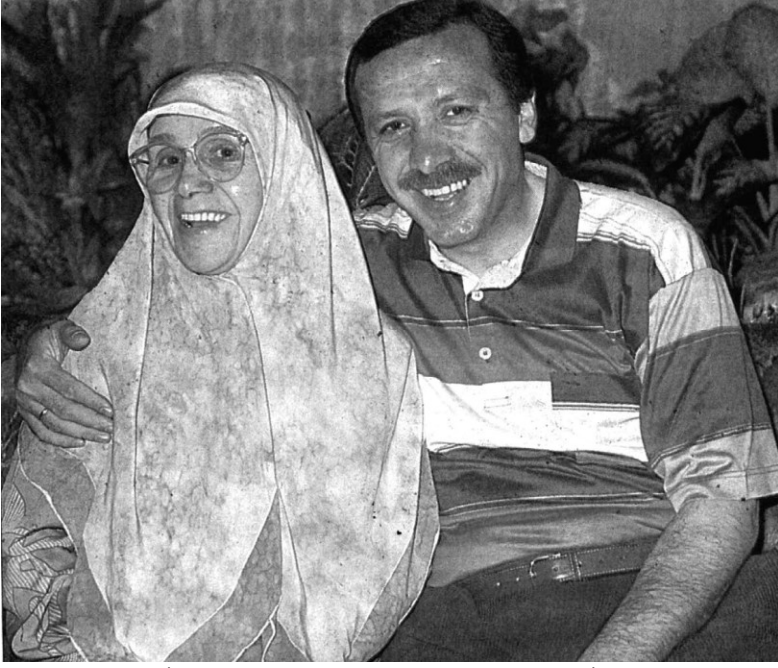
تنزيله اردوغان: والدة رجب طيب اردوغان