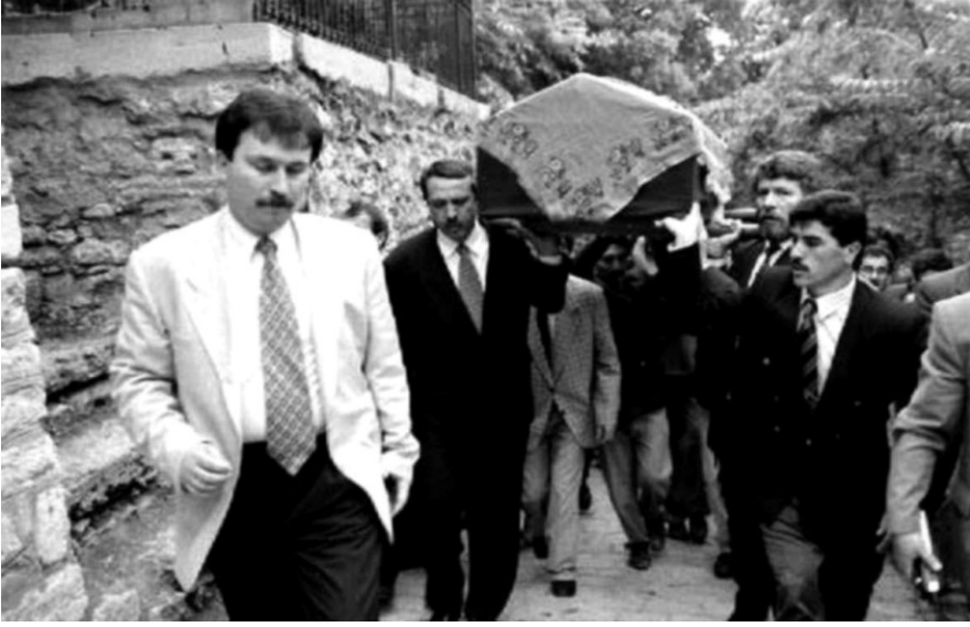
أردوغان لا يتغيب عن أداء واجب العزاء، ويشارك في حمل النعش أيضا