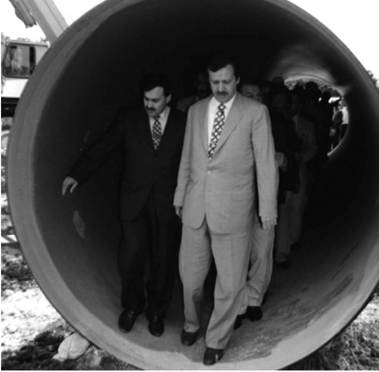
أردوغان أثناء تفقد مشروع خط إساءة المياه باسطنبول