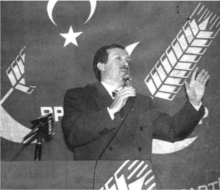
أردوغان رئيسا لحزب الرفاه في مدينة اسطنبول عام 1985