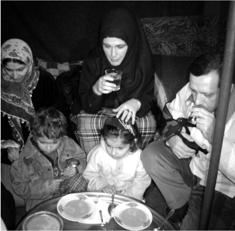
أردوغان على مائدة إفطار رمضانية