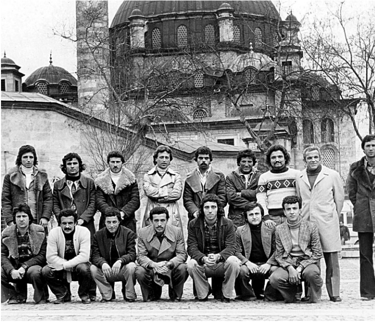
أردوغان بين أصدقائه