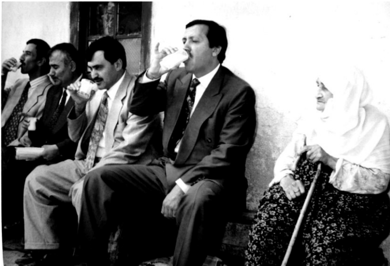
أردوغان يتناول العيران (شراب الزبادي) الذي أعدته له السيدة العجوز