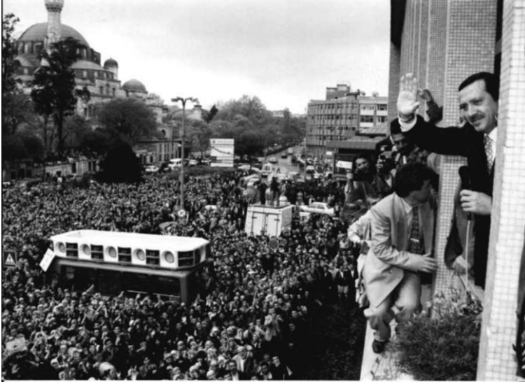
أردوغان يودع المواطنين قبل ذهابه إلى سجن بينار حصار