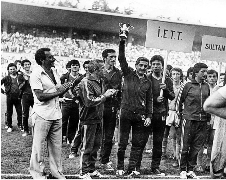
أردوغان لاعبا في فريق كرة القدم بنادي هيئة النقل العام عام 1975