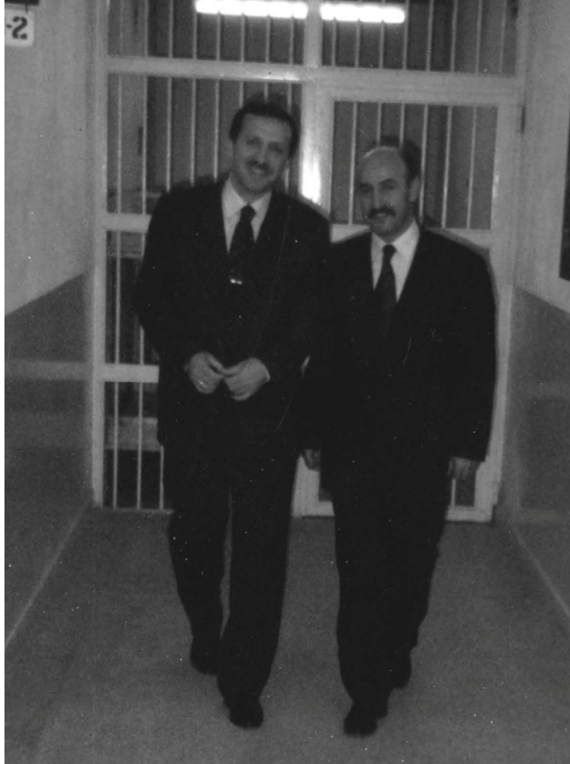
أردوغان عند دخوله سجن بينار حصار