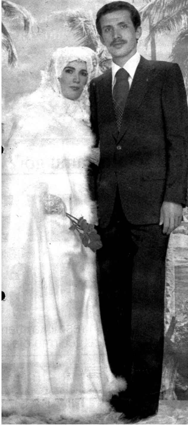
أردوغان وزوجته السيدة أمينة غولباران