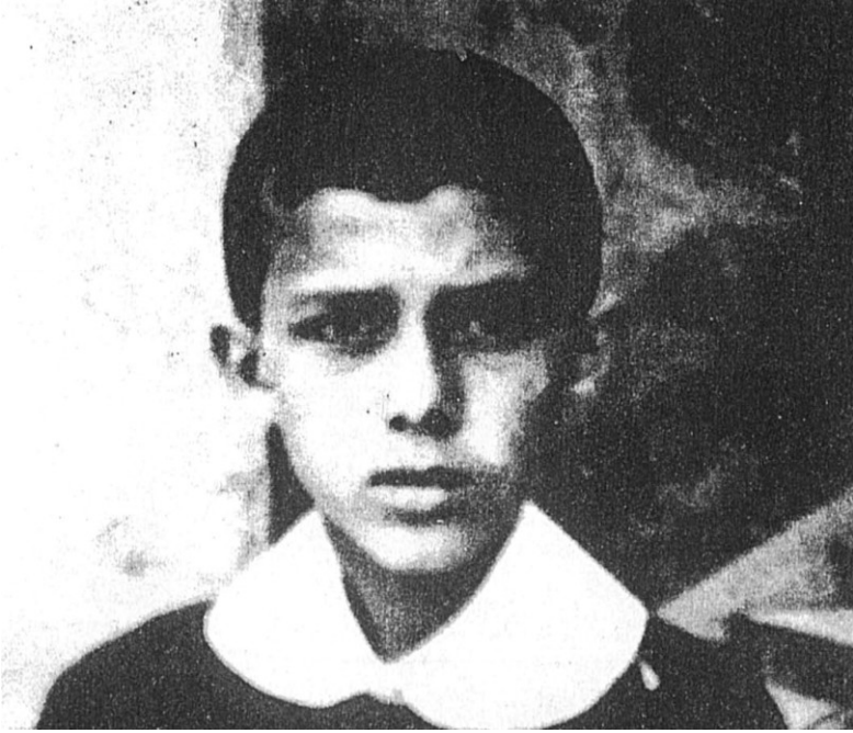
اردوغان في المدرسة الابتدائية