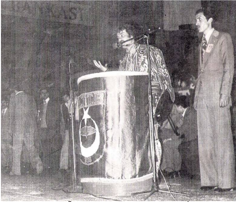
أردوغان رئيساً لجناح الشباب بحزب السلامة الوطني عام 1976