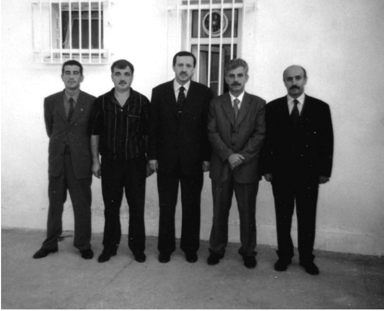
أردوغان مع زائريه في سجن بينار حصار