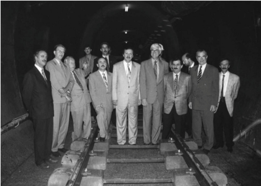
أردوغان يتفقد مشروعات خدمية باسطنبول