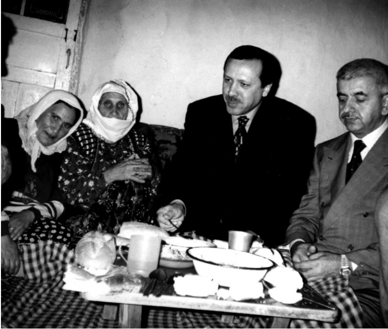
أردوغان يأكل مع الفقراء مما يأكلون، ويشرب مما يشربون