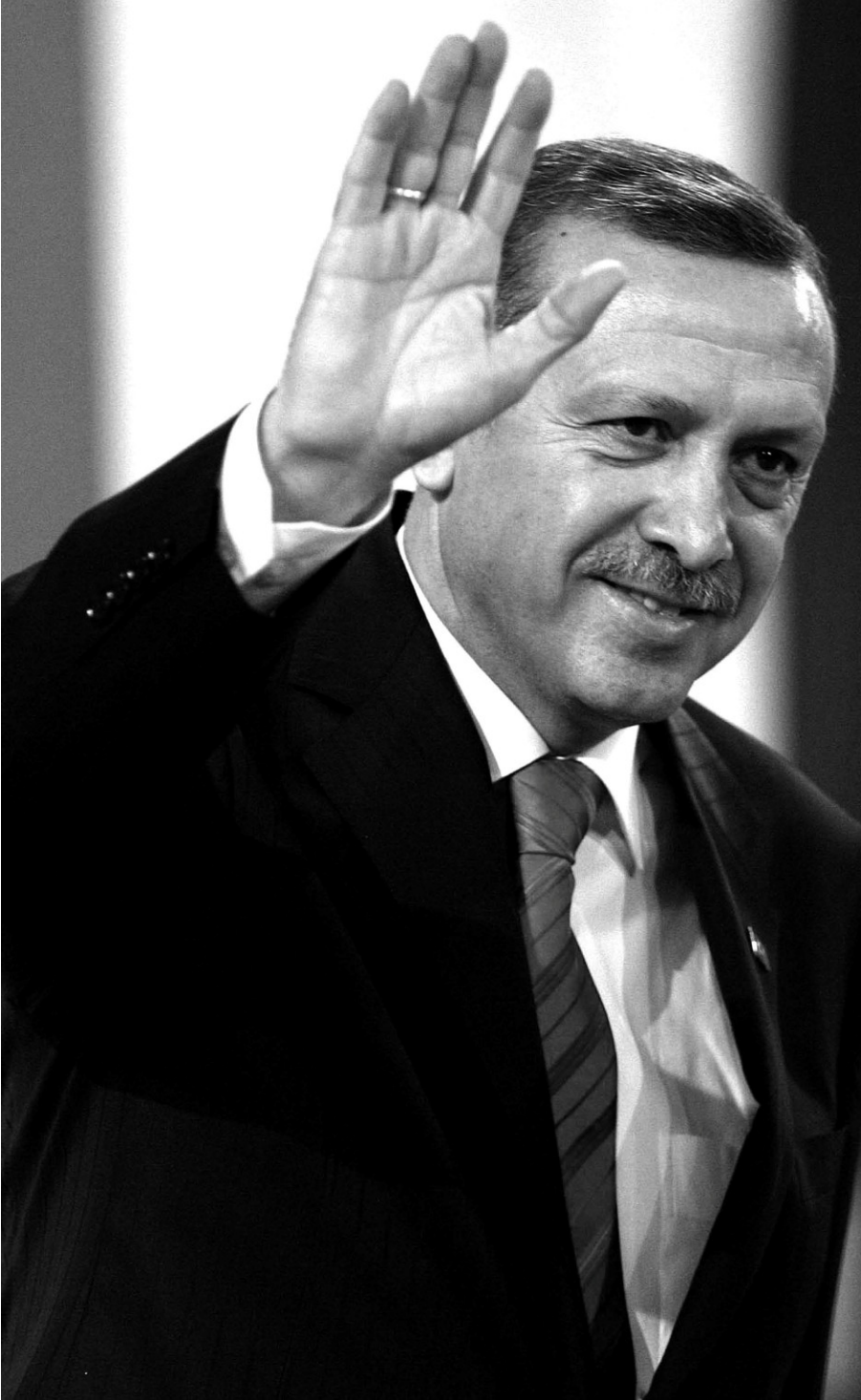
رجب طيب أردوغان