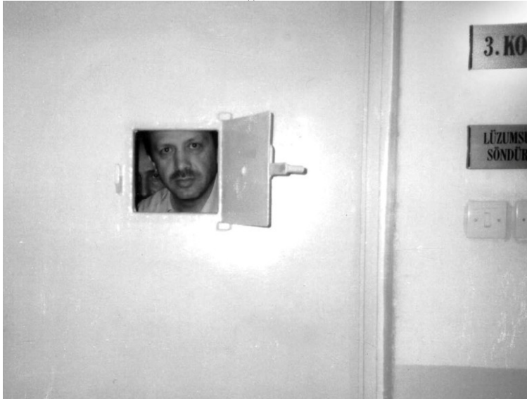
أردوغان في سجن بينار حصار

"نحاكم الأشعار، ونمنع الأفكار، وونعلق الحريات،