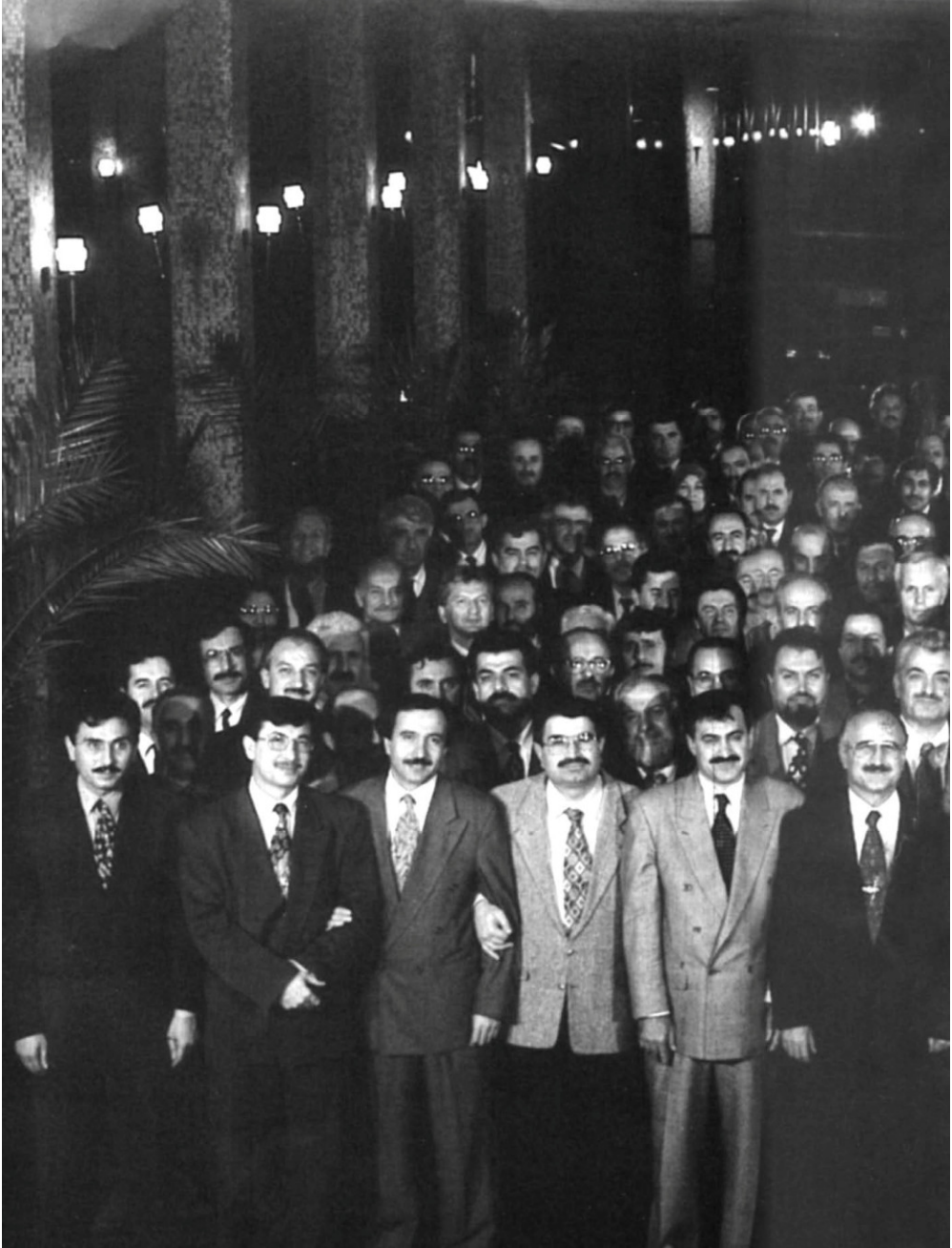
رجب طيب اردوغان رئيس بلدية اسطنبول مع فريق العمل بالبلدية